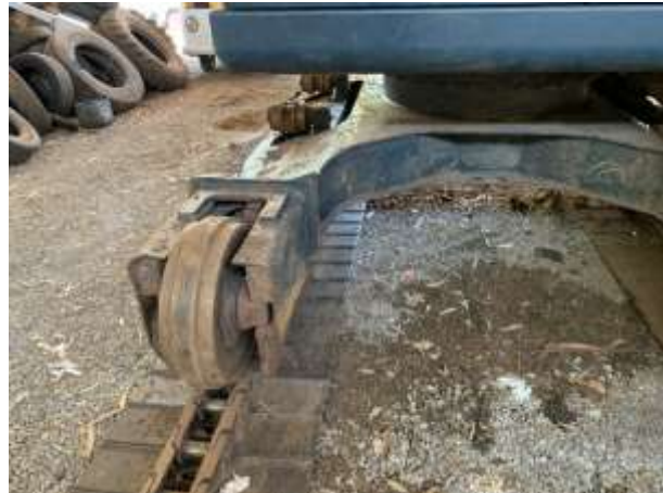
8.8. Foto 8