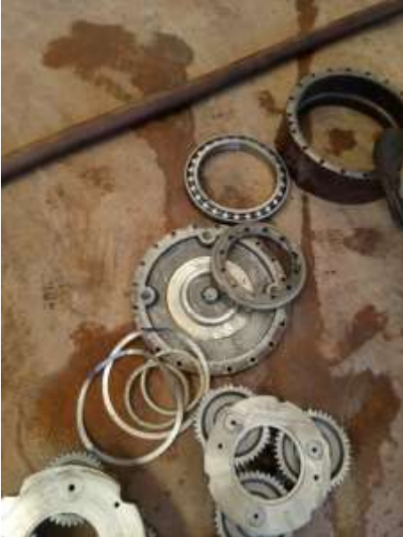
8.10. Foto 10