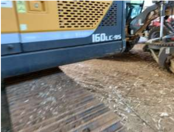
8.7. Foto 7